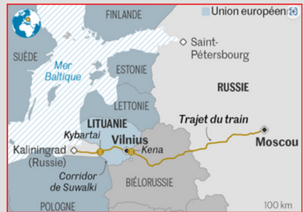
Infographie Le Monde (2022)

L'imaginaire lituanien est imprégné de l'occupation soviétique. Une période où la censure et la prééminence du régime rouge rythme la vie de ce pays balte et de sa population. Depuis l'annexion de la Crimée par la Russie en 2014 puis du déclenchement de l'invasion en Ukraine en 2022, on constate une résurgence des dépenses de défense et une accentuation de la présence otanienne dans les pays baltes et notamment la Lituanie. L'Allemagne, en l'occurrence, leader du groupe tactique de l'OTAN en Lituanie, y renforce ses positions.