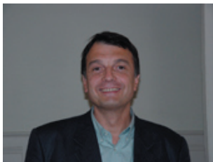
Le Président d'Honneur