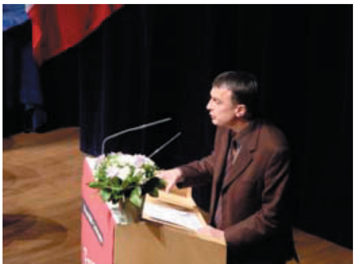
Les actes du Colloque seront publiés pour la fin d'année 2004. Texte : Copyright www.infoguerre.com