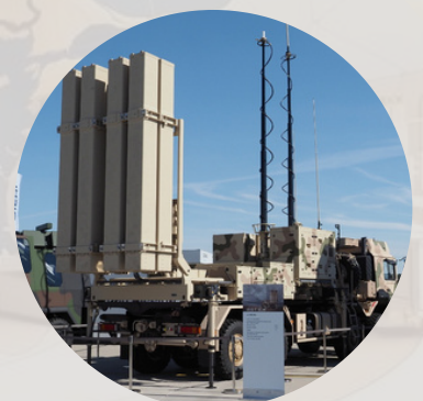
IRIS - T SLM

Système de Radar : radar 3D de surveillance et de traçage TRML-4D